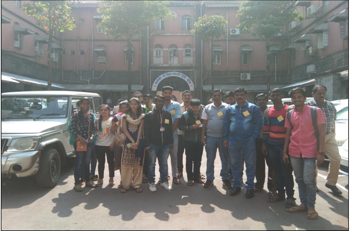
Kolhapur Mahanagarpalika Visit. Date : 01/02/2019