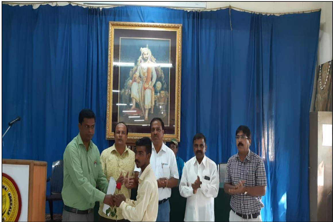
Jagtik Apang Din & Matdan Janjagrti Programme. Date : 14/12/2018